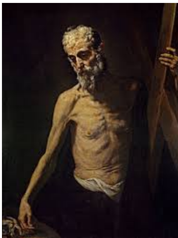
San Andrés (José de Ribera)

José de Ribera (1591-1652). Trabajó en Nápoles, donde era conocido como Spagnoletto y donde se vio influido por la obra de Caravaggio, como se puede observar en su obra de San Andrés. Acostumbraba a iluminar los rostros e introducir más color que Caravaggio. Obra destacada: La mujer barbuda, Isaac y Jacob, Martirio de San Felipe, La Magdalena, etc.